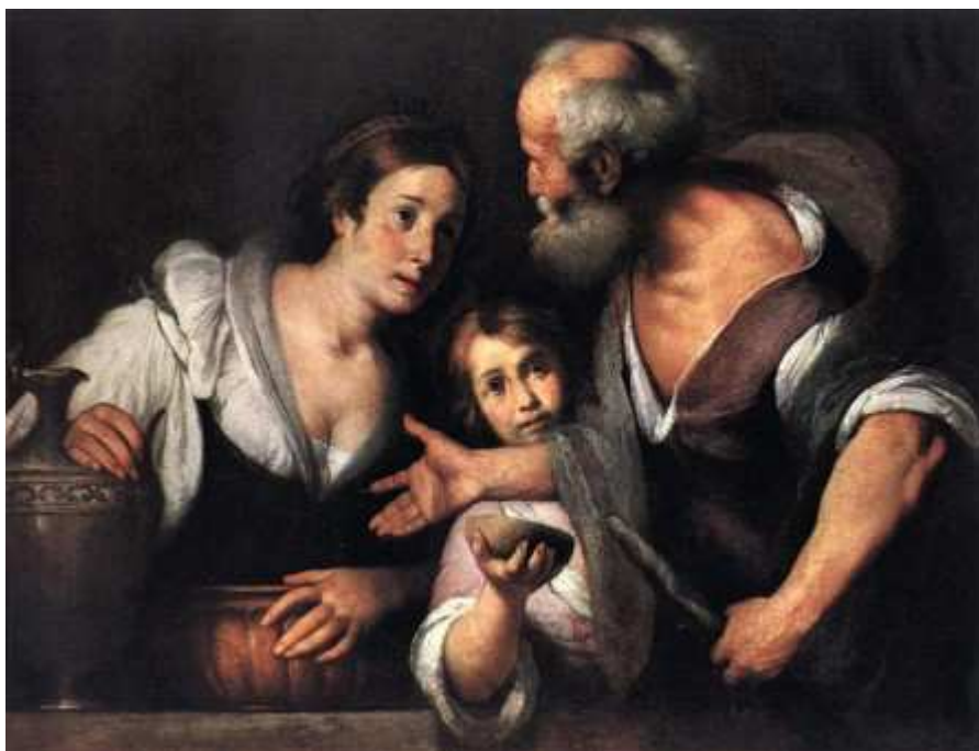
Le prophète Elie et la veuve de Sarepta, Bernardo STROZZI, XVIIe s.

Extrait de Mille et Un secrets, Parcours Eaux Vives, éditions CRER