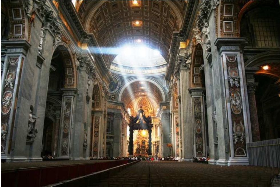
Basilique Saint Pierre de Rome