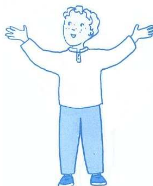
Jésus, tu es ma lumière