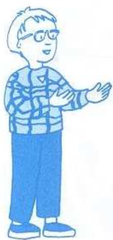
Jésus, tu es devant moi

Jésus, tu es devant moi Jésus, tu es derrière moi Jésus, tu es en haut, en bas Jésus, tu es autour de moi Jésus, tu es dans mon cœur Jésus, tu es ma lumière Jésus, je t'aime !