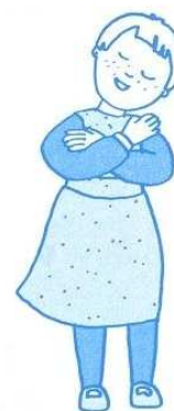
Jésus, je t'aime