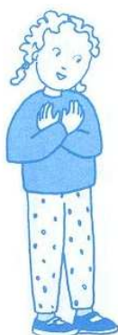
Jésus, tu es dans mon cœur