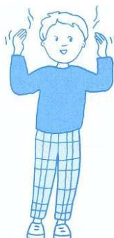
Jésus, tu es derrière moi