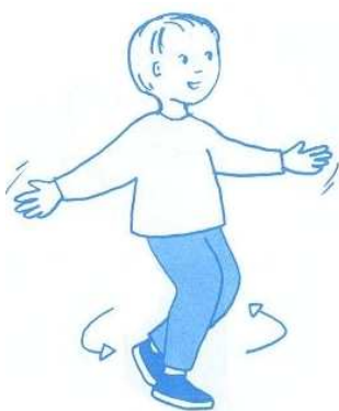
Jésus, tu es autour de moi